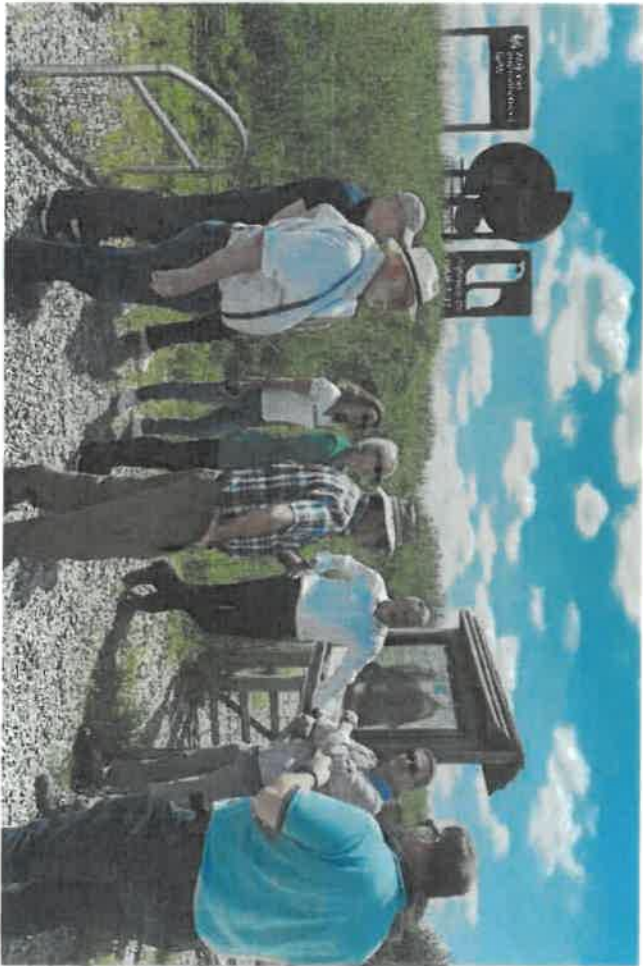
Visites de ZITs en Belgique le 24 juin 2024